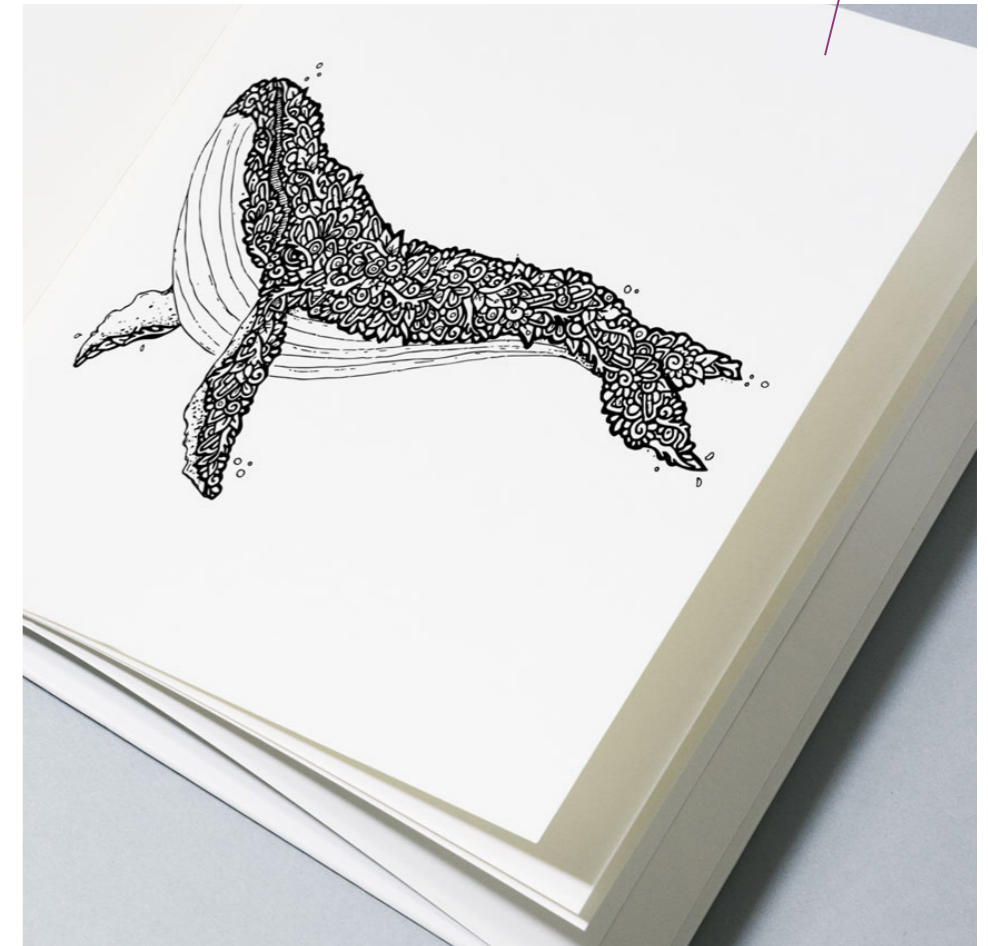
/ Texte, photos : © Caroline DUJARDIN / Illustrations : © Pauline ROUSSEAU

Il célèbre la joie de l'acte créatif et la beauté de la vie. Tout comme la méditation, il se veut libérateur et thérapeutique.